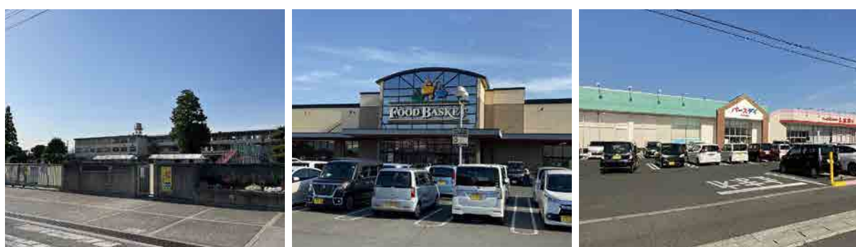
第一福田小学校 ニシナフードバスケット パースデイ・しまむら